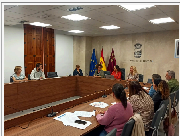
MUNICIPIO DE FORTUNA