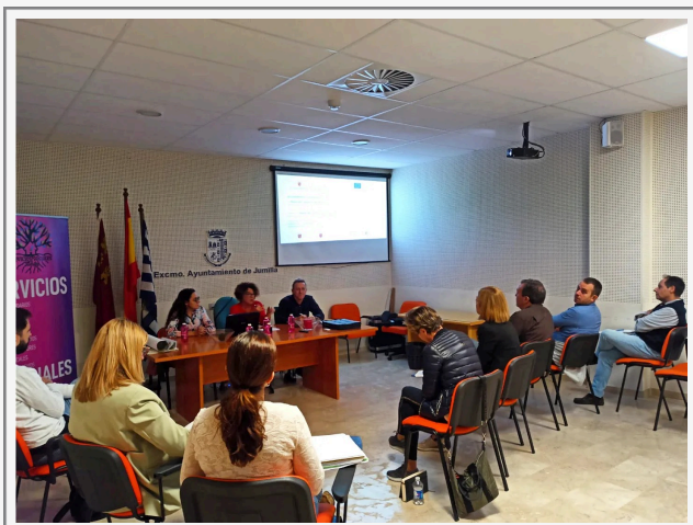
MUNICIPIO DE JUMILLA

La incorporación de nuevos municipios es un logro de todas las instituciones y entidades implicadas, que apuestan por la erradicación del chabolismo y por el acceso de todas las personas a una vivienda digna.