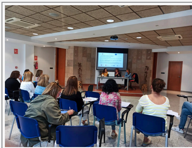
MUNICIPIO DE SAN PEDRO DE PINATAR