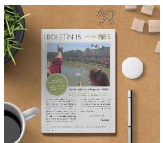
Boletín 15, junio 2022 (12pág.)