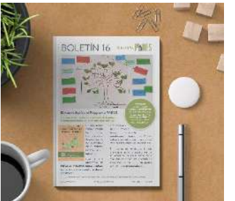
Boletín 16, agosto 2022 (12pág.)