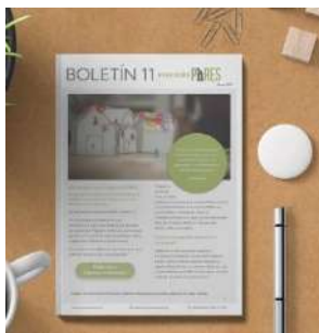
Boletín 11, marzo 2021 (16 pág.)

En el momento de presentar esta memoria, las publicaciones que el Programa ha llevado a cabo en formato de boletín son un total de 16.