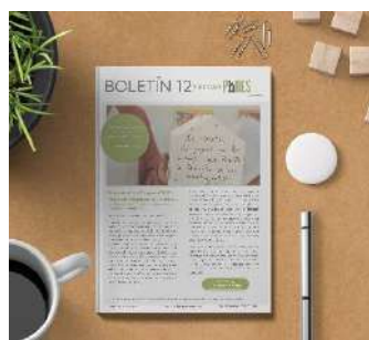
Boletín 12, julio 2021 (11 pág.)