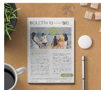
Boletín 13, agosto 2021 (12pág.)