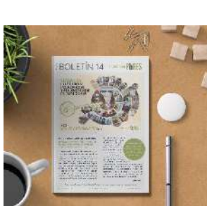
Boletín 14, marzo 2022 (12pág.)