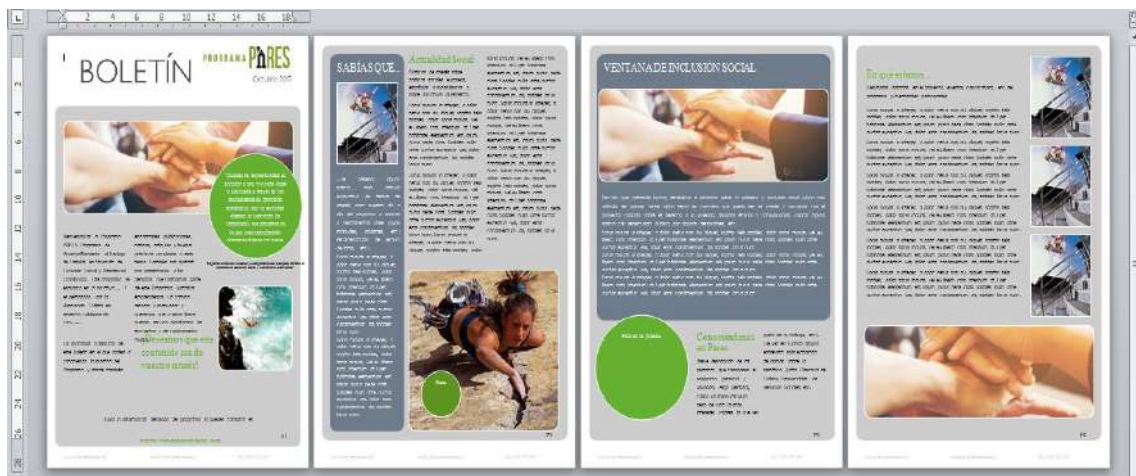
Vista de la plantilla de Boletín Digital