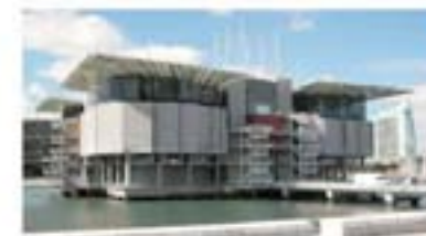
Oceanario de Lisboa

Gobierno de Portugal http://www.portugal.gov.pt/ Presidencia de la República Portuguesa www.presidencia.governo.pt/ Turismo de Portugal http://www.turismodeportugal.pt