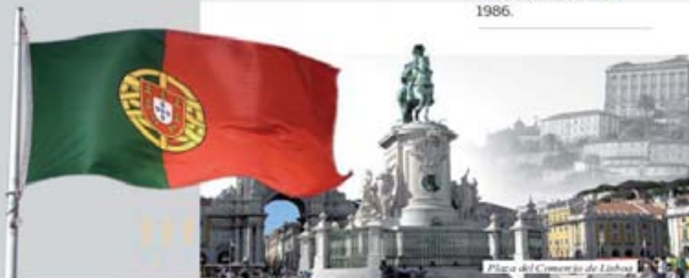
Plaza del Comercio de Lisboa