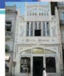
Antiguo comercio de Oporto