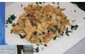
El bacalao es uno de los platos típicos de Portugal