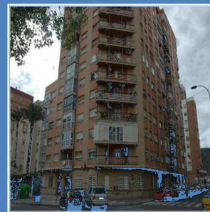
Alameda de San Antón, 29. 30205 - CARTAGENA Tfno.: 968 53 43 38 Fax: 968 31 47 57