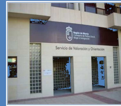
C/ Huerto de las Bombas, nº 8 (Entrada por Plaza de Toledo), 30009 - MURCIA Tfno.: 968 37 55 37 Fax: 968 37 55 51